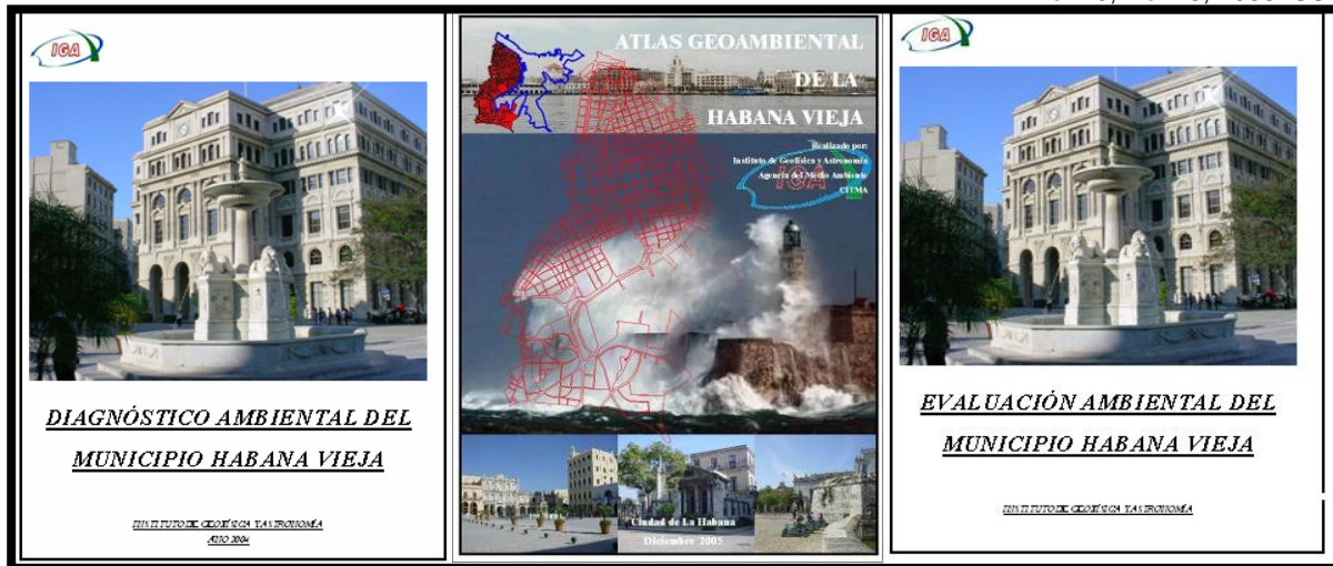
Figura 3: Partes que conforman el Proyecto “Evaluación Ambiental del Municipio Habana Vieja”