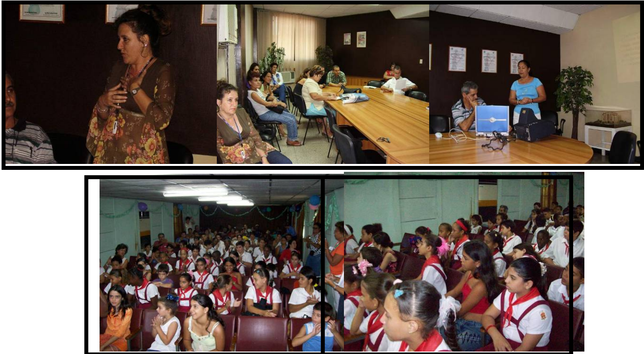
Figura 2: Realización de Conferencias, Talleres y Seminarios

Los sectores con los que se trabajó fueron representativos de los diferentes niveles de enseñanza (primaria, secundaria y universitaria) y directivos de empresas e instituciones con incidencia negativa sobre el estado del medio ambiente en el territorio.